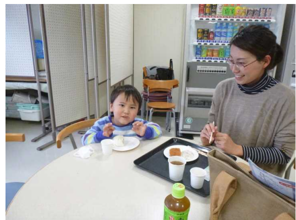
子供も美味しいと言って食べました。