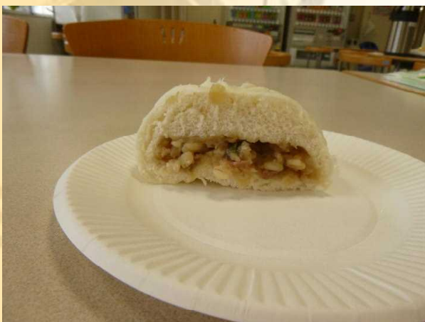
押し麦入り中華まんの断面。麦が見えます。