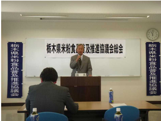
藤波会長あいさつ

6月3日（月）アグリプラザ3階で栃木県米粉食品普及推進協議会の総会が開催されました。総会終了後は米粉を使った料理の展示と試食会が催され、参加者全員がその料理に舌鼓を打っていました。特に、宇都宮白楊高校の生徒が米粉のあんパンを作るなど若い世代にも米粉が食材として浸透し今後の利用拡大が期待されます。