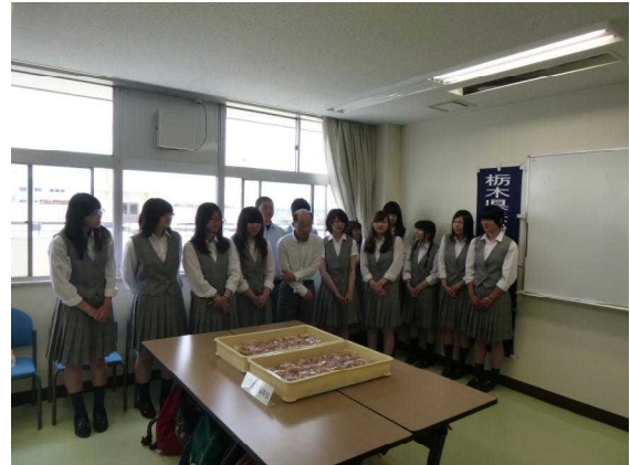
宇都宮白楊高校の皆さん